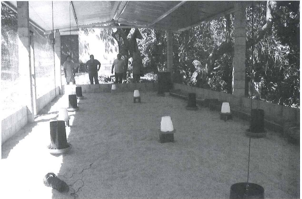
Galera terminada y equipada esperando a las gallinas ponedoras.

En el caso del proyecto de los jóvenes, se construyó la galera para tener las condiciones de la granja, la cual fue construida por los jóvenes y solo se pagó el albañil, pues ninguno de los jóvenes tiene experiencia en construcción, pero si, ellos llevaron toda la parte de auxiliar, por lo que se tuvo que contratar al albañil por servicio, también se contrató a un electricista por servicio para la instalación eléctrica en la granja, logrando la construcción satisfactoriamente.