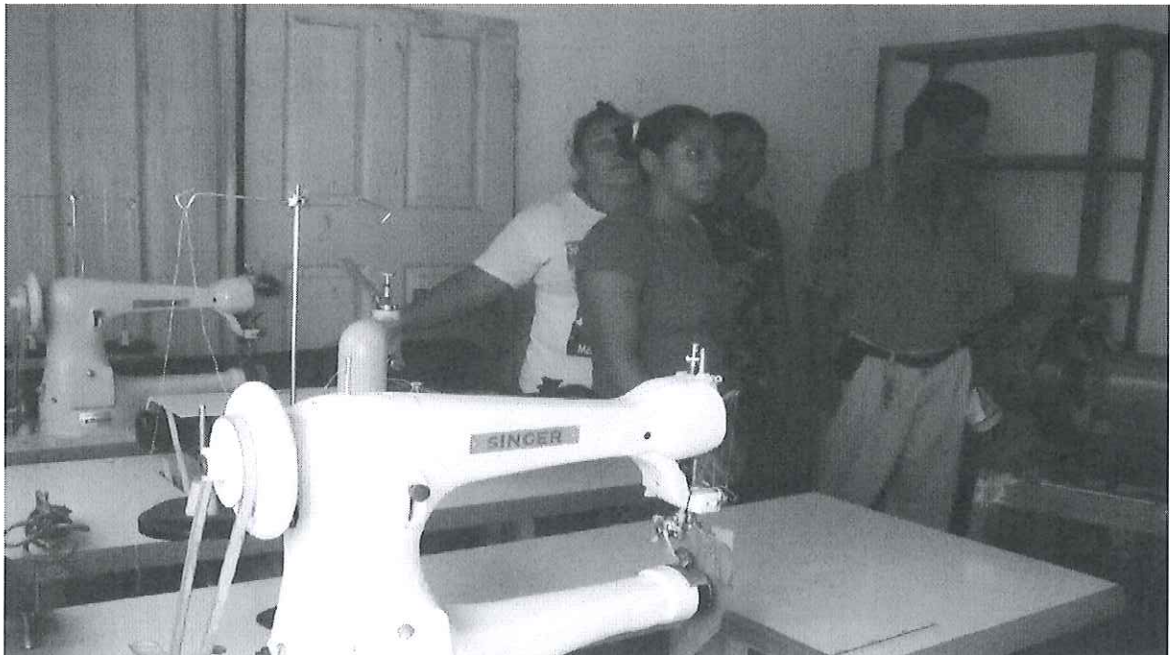
Maquinaria a utilizar en el taller de zapatería de las mujeres de la comunidad San Francisco Angulo