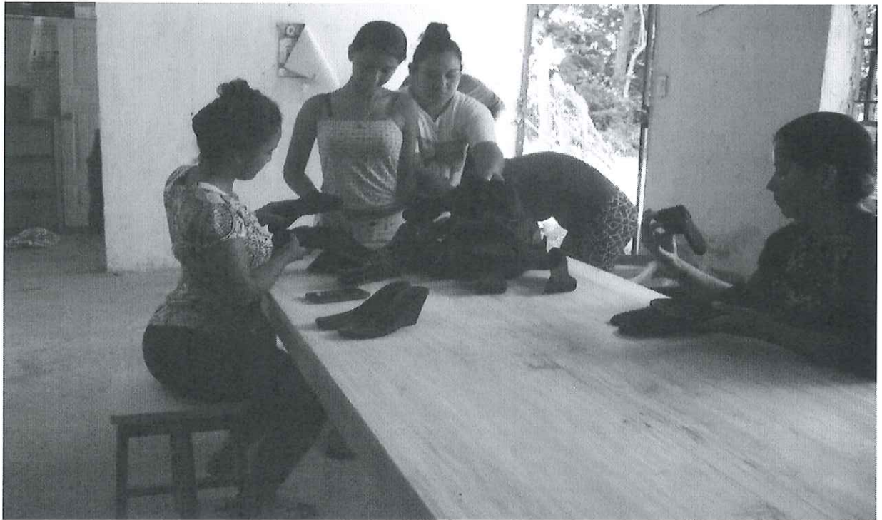
Las mujeres observan los modelos de los zapatos que serán su fuente de trabajo a futuro