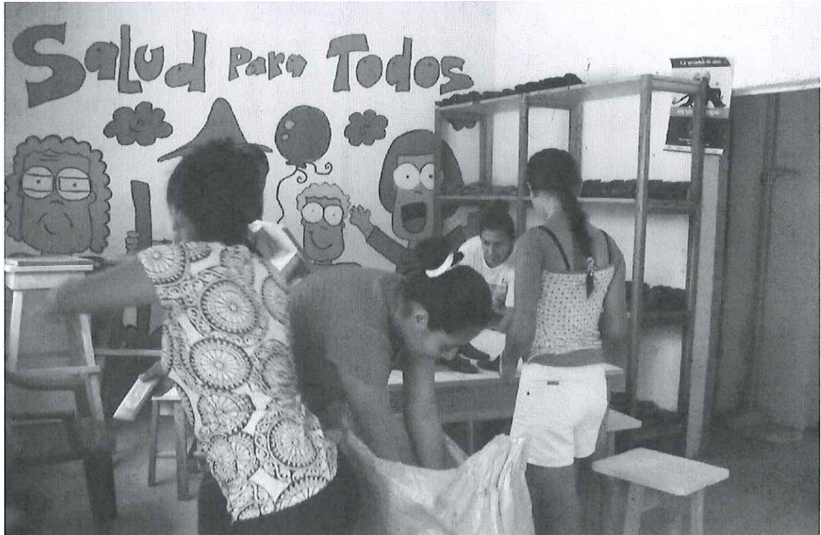
Las mujeres revisan los materiales para su taller de zapatos y sandalias