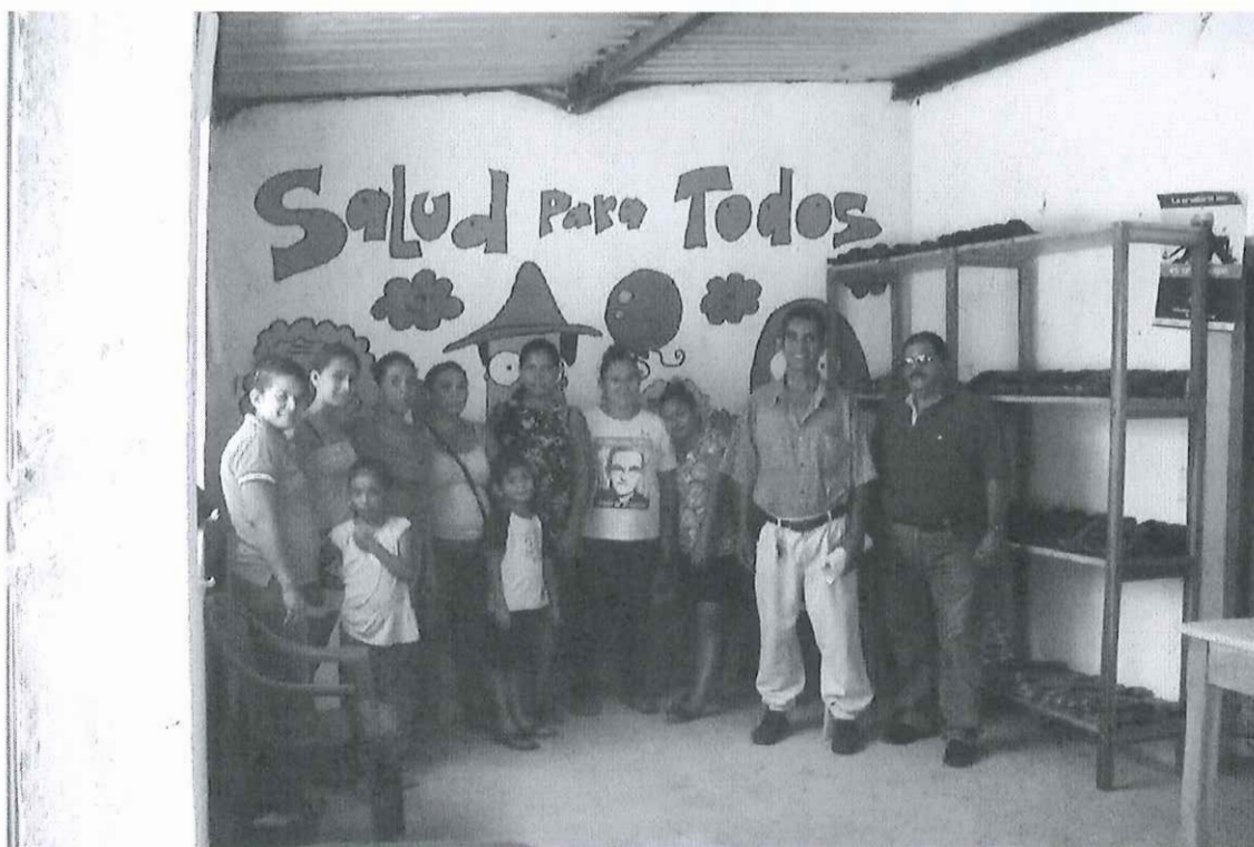
Espacio donde funcionara el taller de zapatería del grupo de mujeres.