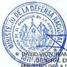
DAVID VICTORIANO MUNGUÍA PAYÉS GENERAL DE DIVISIÓN MINISTRO DE LA DEFENSA NACIONAL

artículo 158 romano V, literal b) de la LACAP, relativa a la invocación de hechos falsos para obtener la adjudicación de la contratación. Se entenderá por comprobado el incumplimiento a la normativa por parte de la Dirección General de Inspección de Trabajo, si durante el trámite de re-inspección se determina que hubo subsanación por haber cometido una infracción, o por el contrario y se remitiere a procedimiento sancionatorio, y en este último caso deberá finalizar el procedimiento para conocer la resolución final. XVIII) NOTIFICACIONES Y COMUNICACIONES: El "CONTRATISTA": [REDACTED], [REDACTED] y el "CONTRATANTE": Ministerio de la Defensa Nacional Kilómetro 5½, Carretera a Santa Tecla, Dirección de Adquisiciones y Contrataciones Institucionales, [REDACTED]. Todas las comunicaciones o notificaciones referentes a la ejecución de este contrato serán válidas solamente cuando sean hechas por escrito en las direcciones que las partes han señalado. En fe de lo cual suscribimos el presente contrato, en la ciudad de San Salvador, departamento de San Salvador, a los seis días del mes de mayo del año dos mil dieciséis.