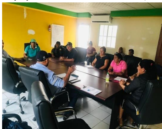
Anexos # 7: reunión con presidentes de ADESCOS de Canton Soledad Terrero, La Orilla y Caserío El Cerrito, Municipio de Carolina.