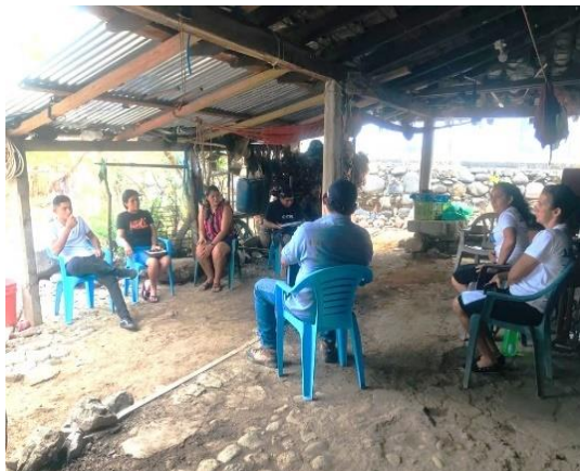
Anexo # 5: Reunión con miembros de ADESCOS del Caserío La Ceiba Centro, La Phytaya, Cantón La Ceibita, Municipio de Carolina.