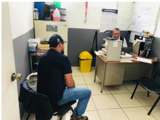
Anexos # 10: coordinaciones con Inspectores de Saneamiento Ambiental para la ejecución de actividad de fumigación en los Municipios de Carolina y San Luis de la Reina.