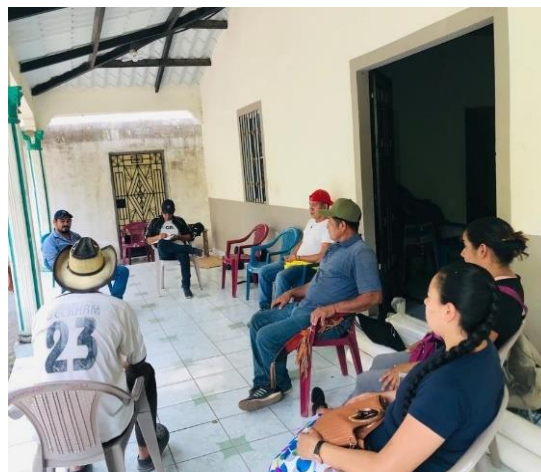
Anexo #° 4 : Reunión con miembros representantes de ADESCOS del Caseríos La Laguna, , El Sicaquite, San Diego Centro, Cantón San Diego,