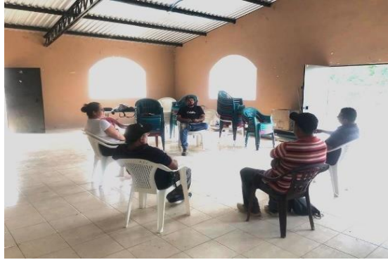
Anexo #° 2: Reunión con miembros de ADESCO del Caserío La Chacara, Cantón Rosas Nacaspilo, Municipio de Carolina.