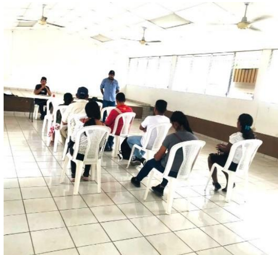
Anexo #° 3 : Reunión con miembros representantes de ADESCOS del Caseríos La Chorrera, Los jícaros, San Marcos, El Chilamo, Cantón San Marcos, Municipio de Villa San Antonio.