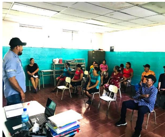
Anexos # 9. Reunión con miembros de ADESCO, padres de familias y profesor del Caserío San José Cureña, Cantón Tijeretas, Municipio de Torola.