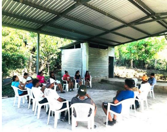
Anexos # 8: Reunión con miembro de ADESCO del Caserío El Bajío, Cantón San Marcos, Municipio de Villa San Antonio.