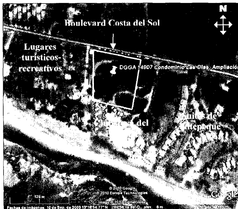
Figura 2. Croquis de ubicación con referencias y colindancias.