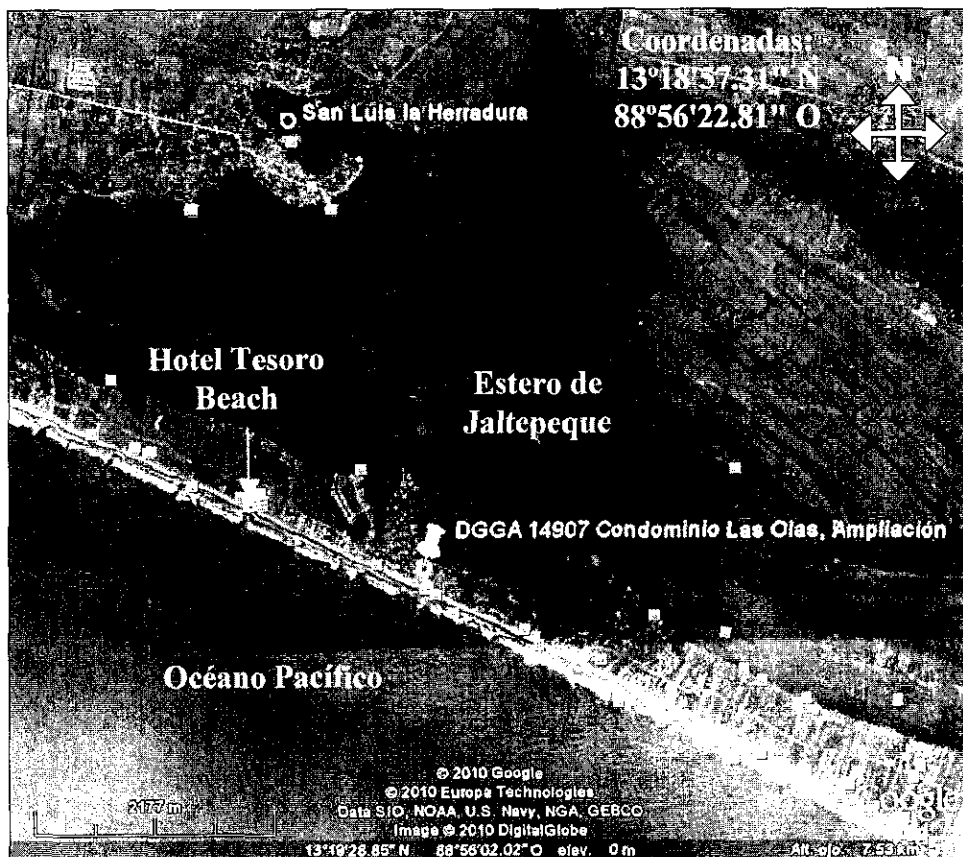
Figura 1. Croquis de ubicación y coordenadas geográficas.