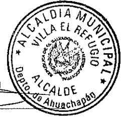
Wilfredo Barrientos Posada Alcalde Municipal de El Refugio