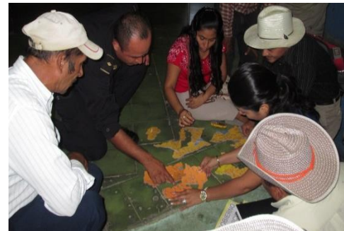
FIGURA N° 1: Actividades de capacitación al grupo gestor

• Con el apoyo de las unidades administrativas y financieras de la municipalidad, se elaboró un programa multianual de inversión y de financiamiento, con las proyecciones financieras y las posibles fuentes de financiamiento para los proyectos consensados.