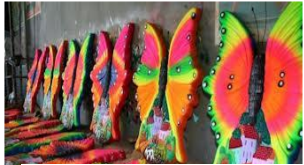
FIGURA N° 13: Cerámica de barro, patrimonio de Ilobasco

Estimular la protección de los recursos naturales del territorio, de manera que se cuente con ellos para las presentes y futuras generaciones, logrando también disminuir la vulnerabilidad ambiental.