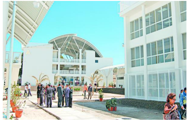
FIGURA N° 10: instalaciones de UNICAES

El programa en cuestión, pretende generar las condiciones necesarias para que paulatinamente se pueda incrementar el