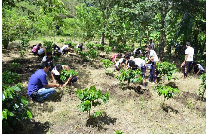
FIGURA N° 7 proyecto de forestación impulsado por la unidad de medio ambiente municipal.

Mejorar las condiciones ambientales de Ilobasco, haciendo posible la protección de sus recursos naturales, lo que contribuirá a elevar el nivel y calidad de vida de la población y a fortalecer su potencial turístico, disminuyendo a la vez la vulnerabilidad de los habitantes, a través de acciones de organización, gestión y disminución de los riesgos presentes en el territorio, de manera que puedan enfrentar resilientemente diferentes eventos adversos que se presenten.