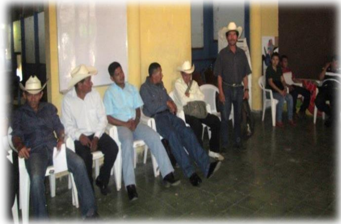
FIGURA N° 13 Integrantes de la IPP analizan Estrategia de Seguimiento y Evaluación

La implementación de la presente estrategia de seguimiento y evaluación tienen como propósito hacer visibles las Instancias de Participación Permanente y las organizaciones sociales que las conforman, de manera que éstas logren insertarse en los espacios de deliberación pública municipal y desarrollar en ellos una actividad crítica y propositiva, enmarcada en un