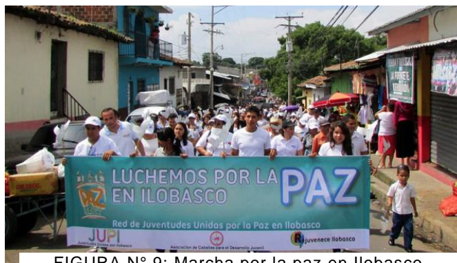
FIGURA N° 9: Marcha por la paz en Ilobasco.