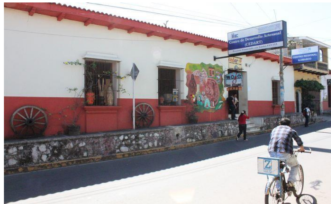
FIGURA N° 11: local de CONAMYPE en vivienda del centro histórico

El desarrollo económico de la localidad es una aspiración social que puede ser real mediante la implementación de mecanismos de coordinación que articulen las iniciativas locales y privadas (MYPES), fortaleciendo el sector empresarial y promoviendo la competencia que dinamiza la economía, lo que a su vez se traduce en innovación (que puede provenir bajo la asistencia técnica y los procesos de formación constante) de la población joven de Ilobasco, así como de las mujeres que son las más afectadas por el desempleo, provocando así una reacción en cadena que desemboque en mayores niveles de desarrollo para las jóvenes y sus familias.