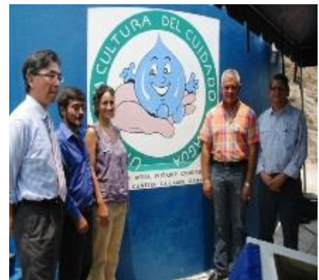
FIGURA N° 12: Inauguración de proyecto de agua en caserío los Hernández.

Mejorar la cobertura del servicio de agua de calidad para el consumo de la población; así como las condiciones de saneamiento, de manera que influya en la mejora de la salud de los habitantes, a través del fomento de prácticas de cuidado y conservación de las fuentes de agua que existen en el territorio y de un uso y mantenimiento adecuado de letrinas.