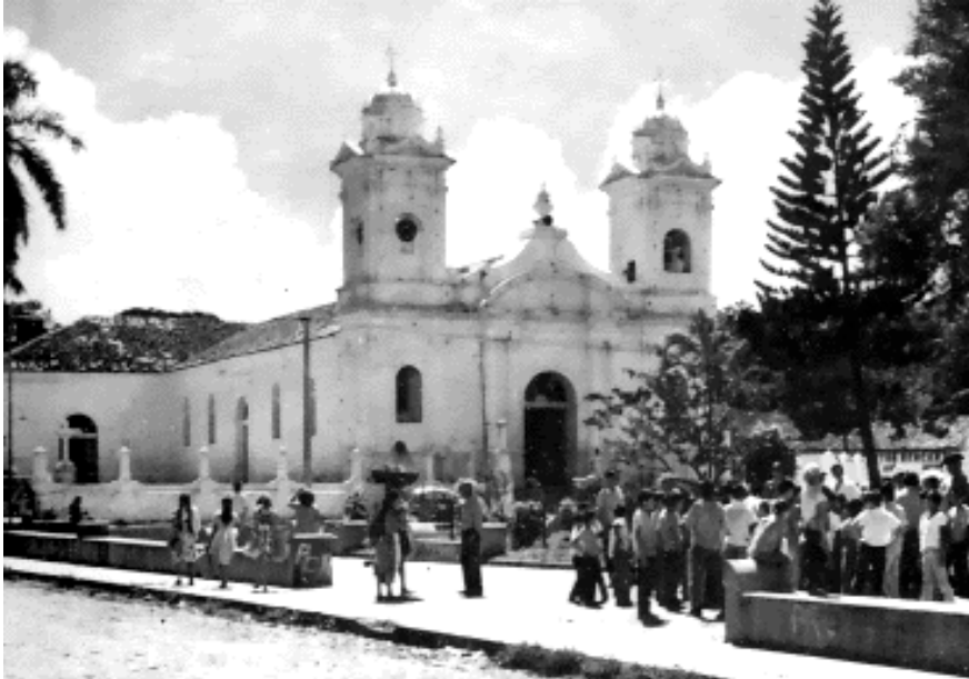
FIGURA N° 2: Fachada antigua de iglesia San Miguel Arcángel

Con respecto al origen de la población de Ilobasco, la historia se remonta a la época precolombina, a finales del año 1500. Esta ciudad fue fundada por tribus Lenca, a principios de 1600, con estrechos vínculos comerciales con Chortíes e indígenas y estos a su vez tuvieron que compartir el lugar en épocas posteriores con Pipiles del habla Náhuatl.