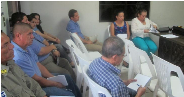
FIGURA N° 8: Taller de diagnóstico con personal institucional

Impulsar la gestión municipal tendiente al fortalecimiento de mecanismos de transparencia que generen mayor participación de la población en los procesos de toma de decisiones sobre el desarrollo del municipio; garantizando la actualización constante del personal municipal para brindar servicios eficaces, eficientes y que respondan a las necesidades de la población.