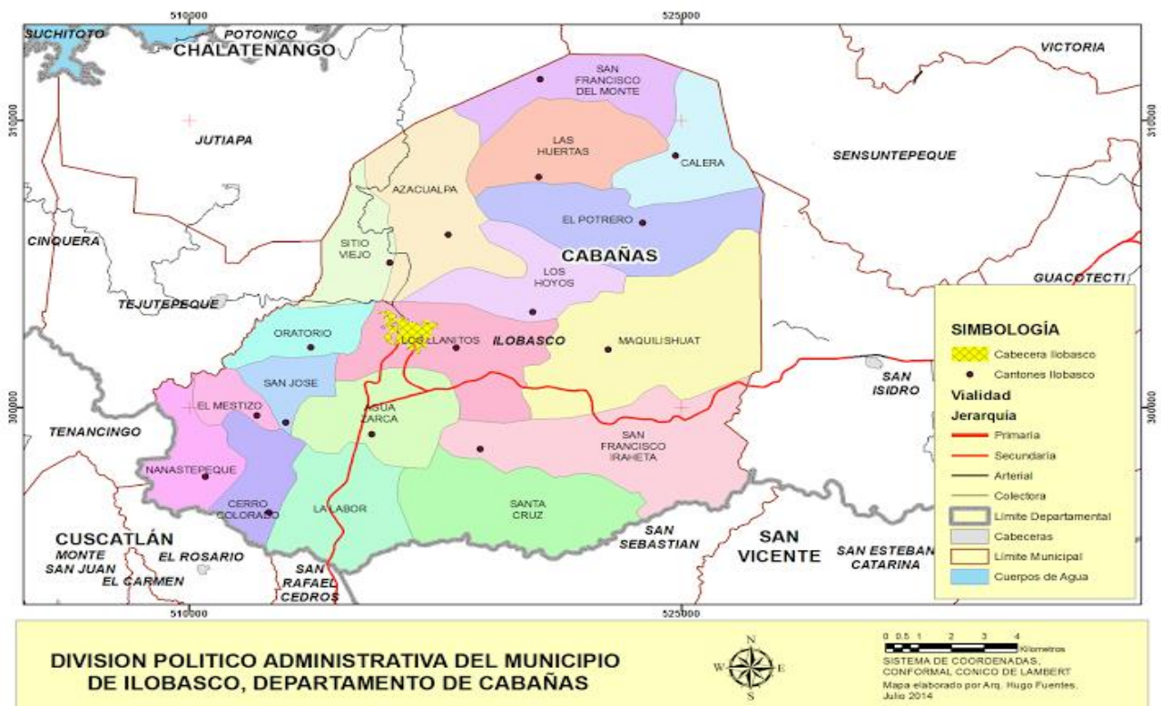
FIGURA N° 3: MAPA DE LA DIVISIÓN POLÍTICA Y ADMINISTRATIVA DE ILOBASCO

Fuente: Elaboración propia CODEIN SA de CV. Con información proporcionada por la Unidad Sistema de Información Territorial. Viceministerio de Vivienda y Desarrollo Urbano. El Salvador. Junio de 2014.