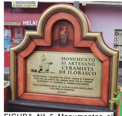
FIGURA N° 5 Monumentos al ceramista.

Garantizar mayores niveles de seguridad y convivencia armónica en la población, especialmente la adolescente y joven, a través de la recreación, el acceso a la educación, a la conectividad vial en buen estado, a las tecnologías de la información y la comunicación, la formación técnica de calidad. Así como el acceso a servicios básicos integrales y de salud, que mejoren la calidad y cantidad de vida de la población.