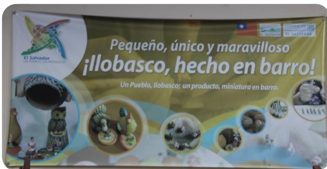
FIGURA N° 6 Promocional del programa “un pueblo, un producto”

Garantizar un crecimiento equilibrado y equitativo de la economía del municipio, a través del estímulo de la inversión, el fomento del turismo y el desarrollo artesanal, el incremento y mejora de la producción agrícola, para la generación de empleos y recursos, de manera que la población mejore sus ingresos, que le garanticen calidad de vida para sí y para su familia.