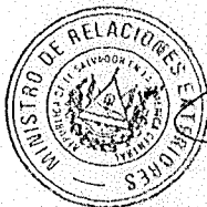
Carlos Alfredo Castaneda Magaña Ministro de Relaciones Exteriores